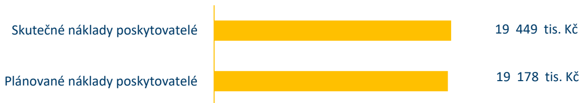
Graf č. 4: Porovnání plánovaných a skutečných nákladů poskytovatelů soc. služeb v roce 2025

Celkové neinvestiční náklady na zabezpečení služeb a souvisejících aktivit byly pro rok 2025 předpokládány ve výši 19 178 tis. Kč . Celkové vyjádření neinvestičních nákladů na zajištění sociálních služeb a souvisejících aktivit po konečném vyúčtování činí 19 449 tis. Kč .