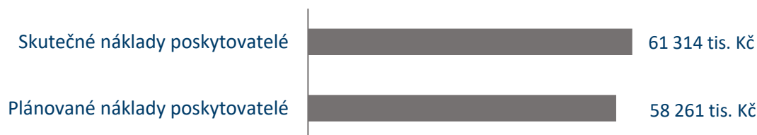
Graf č. 10: Porovnání plánovaných a skutečných nákladů poskytovatelů soc. služeb v roce 2025

Celkové neinvestiční náklady na zabezpečení služeb a souvisejících aktivit byly pro rok 2025 předpokládány ve výši 58 261 tis. Kč . Celkové vyjádření neinvestičních nákladů na zajištění sociálních služeb a souvisejících aktivit po konečném vyúčtování činí 61 314 tis. Kč .