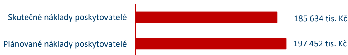
Graf č. 8: Porovnání plánovaných a skutečných nákladů poskytovatelů soc. služeb v roce 2025

Celkové neinvestiční náklady na zabezpečení služeb a souvisejících aktivit byly pro rok 2025 předpokládány ve výši 197 452 tis. Kč . Celkové vyjádření neinvestičních nákladů na zajištění sociálních služeb a souvisejících aktivit po konečném vyúčtování činí 185 634 tis. Kč .