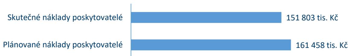
Graf č. 7: Porovnání plánovaných a skutečných nákladů poskytovatelů soc. služeb v roce 2025

Celkové neinvestiční náklady na zabezpečení služeb a souvisejících aktivit jsou byly pro rok 2025 předpokládány ve výši 161 458 tis. Kč . Celkové vyjádření neinvestičních nákladů na zajištění sociálních služeb a souvisejících aktivit po konečném vyúčtování činí 151 803 tis. Kč .