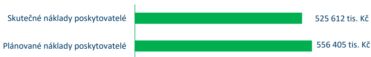
Graf č. 6: Porovnání plánovaných a skutečných nákladů poskytovatelů soc. služeb v roce 2025

Celkové neinvestiční náklady na zabezpečení služeb a souvisejících aktivit byly pro rok 2025 předpokládány ve výši 556 405 tis. Kč . Celkové vyjádření neinvestičních nákladů na zajištění sociálních služeb a souvisejících aktivit po konečném vyúčtování činí 525 612 tis. Kč .