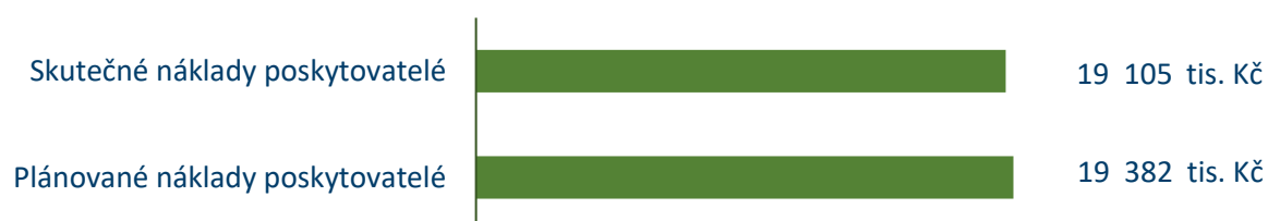
Graf č. 5: Porovnání plánovaných a skutečných nákladů poskytovatelů soc. služeb v roce 2025

Celkové neinvestiční náklady na zabezpečení služeb a souvisejících aktivit byly pro rok 2025 předpokládány ve výši 19 382 tis. Kč . Celkové vyjádření neinvestičních nákladů na zajištění sociálních služeb a souvisejících aktivit po konečném vyúčtování činí 19 105 tis. Kč .