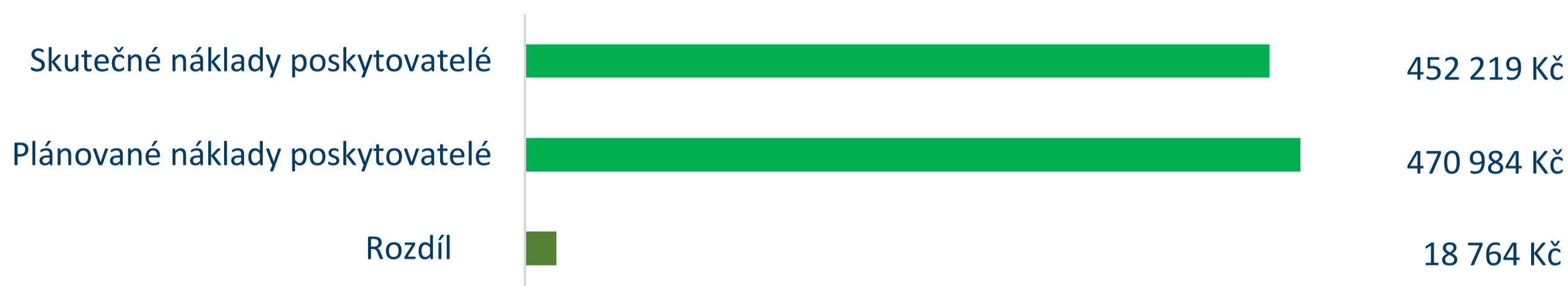
Graf č. 6: Porovnání plánovaných a skutečných nákladů poskytovatelů soc. služeb v roce 2023

**) u dobrovolnictví je uváděn počet dobrovolníků se smlouvou