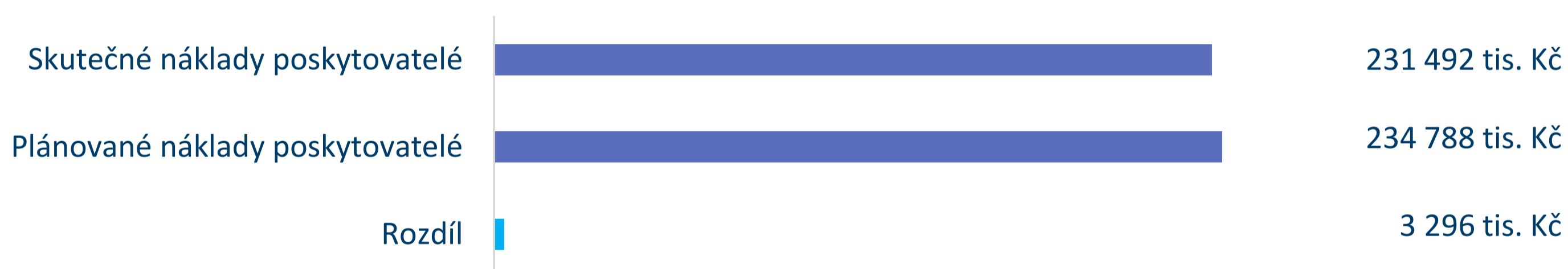
Graf č. 3: Porovnání plánovaných a skutečných nákladů poskytovatelů soc. služeb v roce 2023